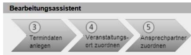
Abbildung 2: Bearbeitungsassistent Schritte 3 bis 5

Über die Schaltfläche " Neuen Termin hinzufügen " im Abschnitt " Wie/Wann/Wo (Veranstaltungstermine) " in der Datenansicht des Weiterbildungsangebotes beginnen Sie mit Bearbeitungsschritt 3 und setzen Ihre Eingabe bis Schritt 5 des Bearbeitungsassistenten fort, um eine weitere Veranstaltung zu erstellen.