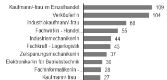
Top-10-Berufe der Berufsausbildungsstellen Kreis Oberbergischer Kreis Berichtsjahr 2025/2026, jeweils aktueller Monat