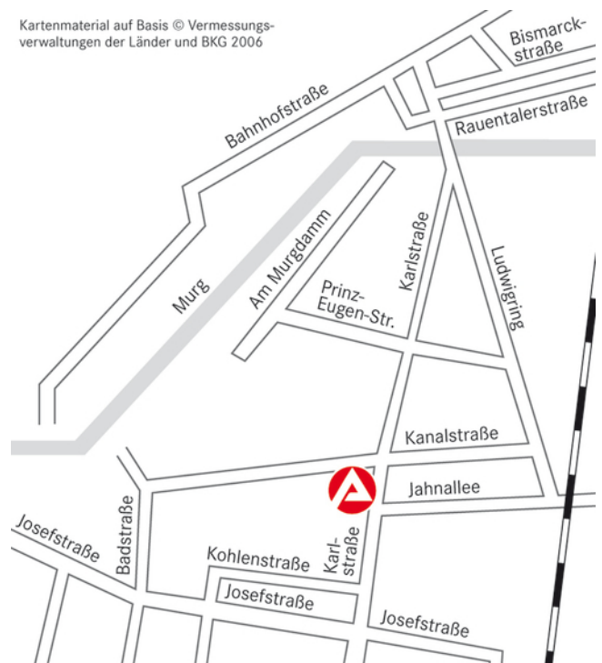
Kartenmaterial auf Basis © Vermessungsverwaltungen der Länder und BKG 2006