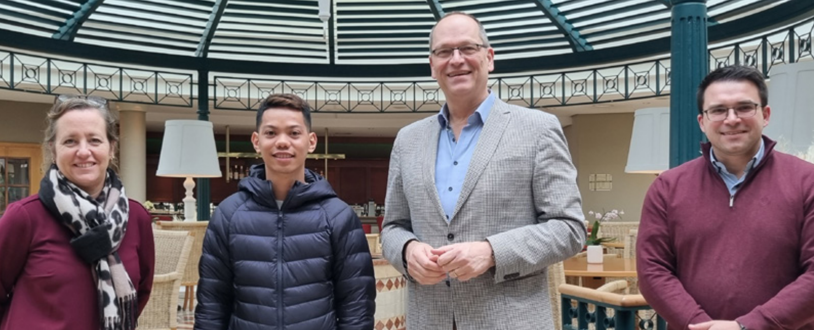
Im A-ROSA Ostseehotel ziehen Personalleitung, Hoteldirektion und Belegschaft bei der Integration an einem Strang.