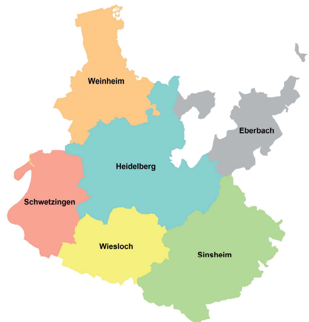
Agentur für Arbeit Heidelberg

Besuche auch die Veranstaltungsdatenbank auf der Internetseite der Agentur für Arbeit Heidelberg, dort findest du interessante Veranstaltungen zur Berufs- und Studienwahl.