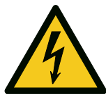
Warnung vor elektrischer Spannung