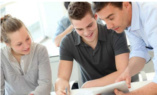
Abb. 1 Die Praktikumsleitung bespricht wichtige Aspekte mit den Schülerinnen und Schülern

Die Schulleiterin bzw. der Schulleiter kann die Verantwortung auf andere Lehrkräfte delegieren. Wenn nicht bereits in schulrechtlichen Regelungen der Länder gefordert, bietet es sich an, in der Schule eine fachkundige Lehrkraft als Praktikumsleitung zu benennen. Diese berät die Schülerinnen und Schüler bei der Auswahl der Praktikumsstelle, begleitet die Durchführung und steht als Ansprechperson zur Verfügung. Zu ihrem Verantwortungsbereich gehört