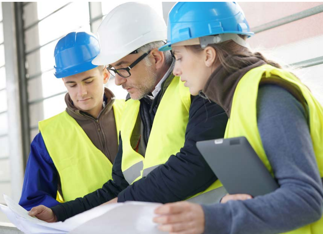
Abb. 6 Durchführung einer Unterweisung

Verhalten im Notfall besprochen werden. Darüber hinaus muss die tätigkeitspezifische Unterweisung am Arbeitsplatz erfolgen. Hier kann die bzw. der Unterweisende am Beispiel der Arbeitsmittel erläutern, auf was die Schülerin oder der Schüler zu achten hat, kann auf Gefahrenstellen und -situationen aufmerksam machen und die ergriffenen Schutzmaßnahmen erläutern. Die bzw. der Unterweisende muss sich davon überzeugen, dass die Inhalte der Unterweisung verstanden wurden und auch umgesetzt werden können. Außerdem muss die Unterweisung im Betrieb dokumentiert werden.