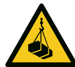
Warnung vor schwebender Last