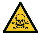
Warnung vor giftigen Stoffen