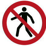
Für Fußgänger verboten