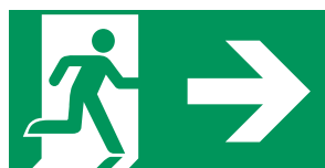
Beispiel für Rettungsweg/ Notausgang mit Richtungspeil