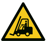
Warnung vor Flurförderzeugen