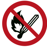
Feuer, offenes Licht, offene Flamme und Rauchen verboten