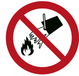
Mit Wasser löschen verboten