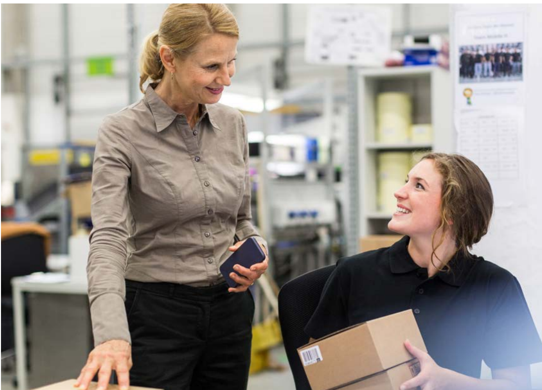
Abb. 3 Der Besuch der Praktikumsleitung im Praktikumsbetrieb

Hilfestellungen sowie ein Verweis zu Lehrmaterialien für die unterrichtliche Vorbereitung werden in Anlage 7 aufgeführt. Ziel der Vorbereitung ist es, die Schülerinnen und Schüler in die Lage zu versetzen, kritische Situationen zu erkennen und sich mit Fragen an ihre Ansprechperson im Betrieb zu wenden. Sie sollen verstehen, dass sie in unbekanntem Situationen besser nachfragen, bevor sie eigenmächtig handeln und dadurch ggf. einen Unfall erleiden (siehe auch Anlage 7 „Unterrichtliche Vorbereitung“). Die unterrichtliche Vorbereitung dient auch der Unterweisung der Schülerinnen und Schüler und muss dokumentiert werden. Dies ist z. B. durch einen Eintrag ins Klassenbuch oder Kursbuch möglich. Alternativ kann ein gesondertes Unterweisungsformular genutzt werden, auf dem sowohl die unterweisende Person als auch die Schülerinnen und Schüler unterschreiben und die Unterweisung zu den behandelten Themen bestätigen (siehe auch Anlage 8 „Dokumentation allgemeine Unterweisung“).