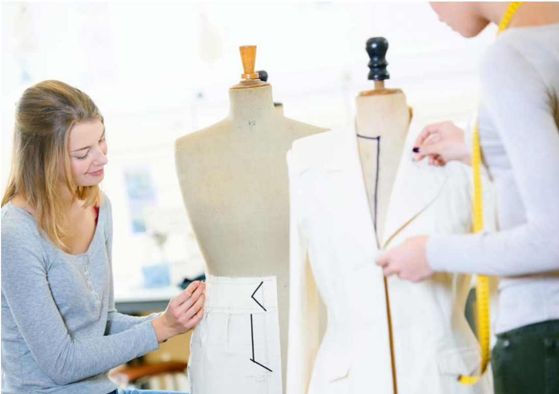
Abb. 5 Die Einblicke in ein Berufsfeld sind vielfältig