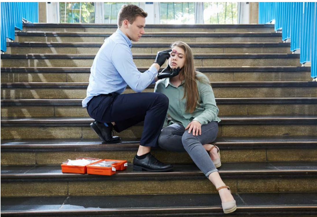
Abb. 7 Jeder Unfall muss der Schule gemeldet werden

Das Prinzip der Unfallmeldung ist in Abbildung 8 dargestellt. Für die Unfallverhütung in den Betrieben gelten neben den staatlichen Arbeitsschutzvorschriften die spezifischen Regelwerke der gesetzlichen Unfallversicherung für eben diesen Betrieb, also die DGUV Vorschrift 1 „Grundsätze der Prävention“ ebenso wie branchen- oder betriebsspezifische Unfallverhütungsvorschriften. Zu Beginn ihres Praktikums werden die Schülerinnen und Schüler daher durch den Betrieb über die für „ihren“ Betrieb geltenden Vorschriften und Maßnahmen zur Sicherheit und Gesundheit informiert – im Praktikum unterliegen auch sie diesen Unfallverhütungsvorschriften. Für Sachschäden gelten unterschiedliche Regelungen. Informationen dazu enthalten die landesspezifischen Regelungen (siehe Kapitel 5.2).