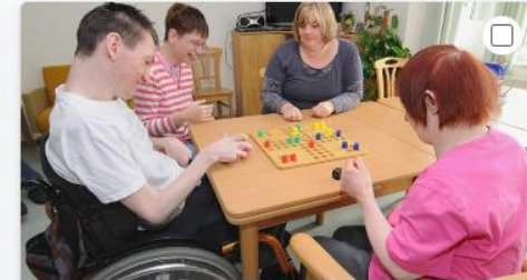
Berufe mit Menschen mit Behinderung