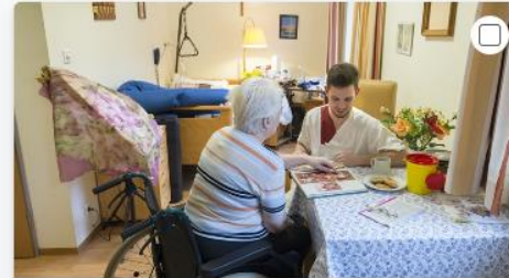
Berufe mit älteren Menschen