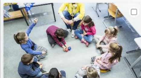
Berufe mit Kindern und Jugendlichen