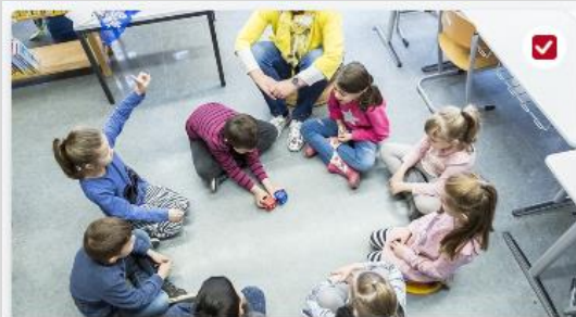
Berufe mit Kindern und Jugendlichen