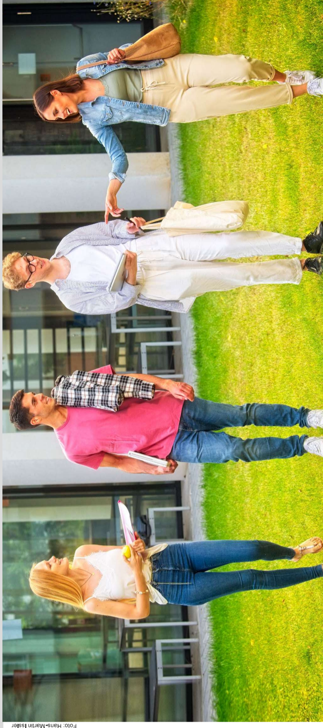
Ob allgemeine, fachgebundene oder Fachhochschulreife: Mit jedem Abschluss steht dir der Weg in eine Ausbildung und ein Studium offen. Informiere dich aber genau, denn je nach Bundesland und Abschluss bestehen Unterschiede.

Mit der allgemeinen Hochschulreife kannst du alle Studiengänge an allen Hochschulen studieren – einen Studienplatz vorausgesetzt. Mit fachgebundener Hochschulreife oder Fachhochschulreife kannst du bestimmte Fächer oder an bestimmten Hochschularten studieren. Verlässt du die Schule mit einem mittleren Schulabschluss, kannst du später noch studieren, auch ohne Abitur. Das deutsche Bildungssystem ist grundsätzlich durchlässig, im Rahmen der Regelungen der Länder.