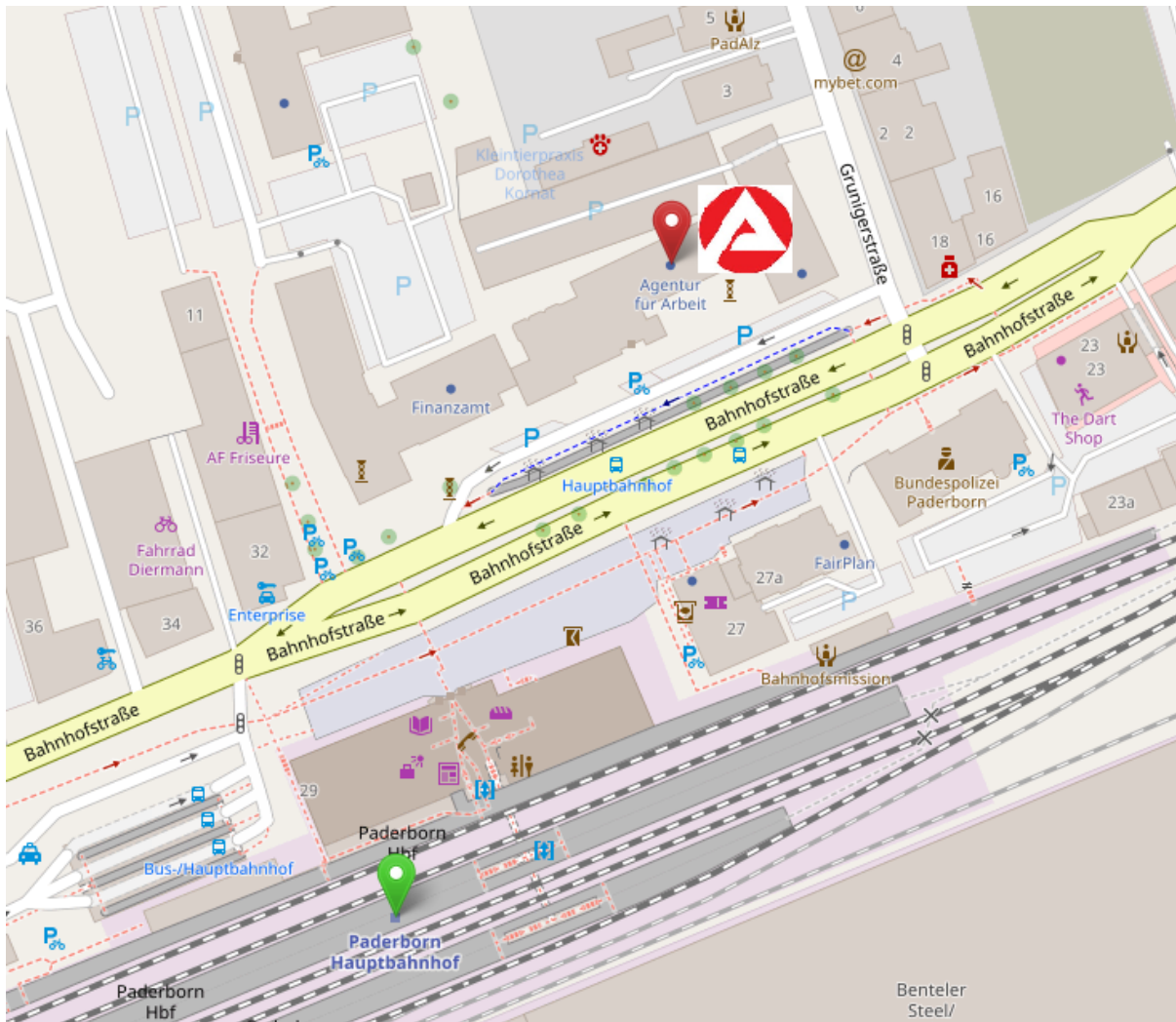
2- Hauptbahnhof und Agentur für Arbeit Paderborn