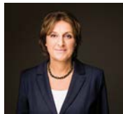
Britta Ernst Ministerin für Bildung, Jugend und Sport des Landes Brandenburg

Warum braucht es eigentlich eine JBA? Praxisbeispiele aus der JBA Frankfurt (Oder) zur erfolgreichen Zusammenarbeit